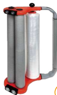
軽量化手動 フィルムディスペンサー XT Orange®