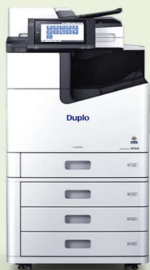
powered by EPSON